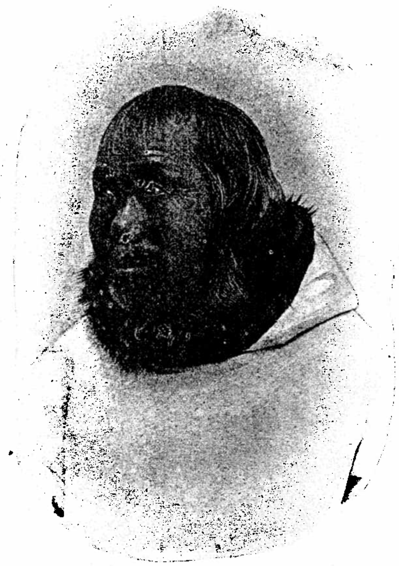
A B I A T U T A U K .