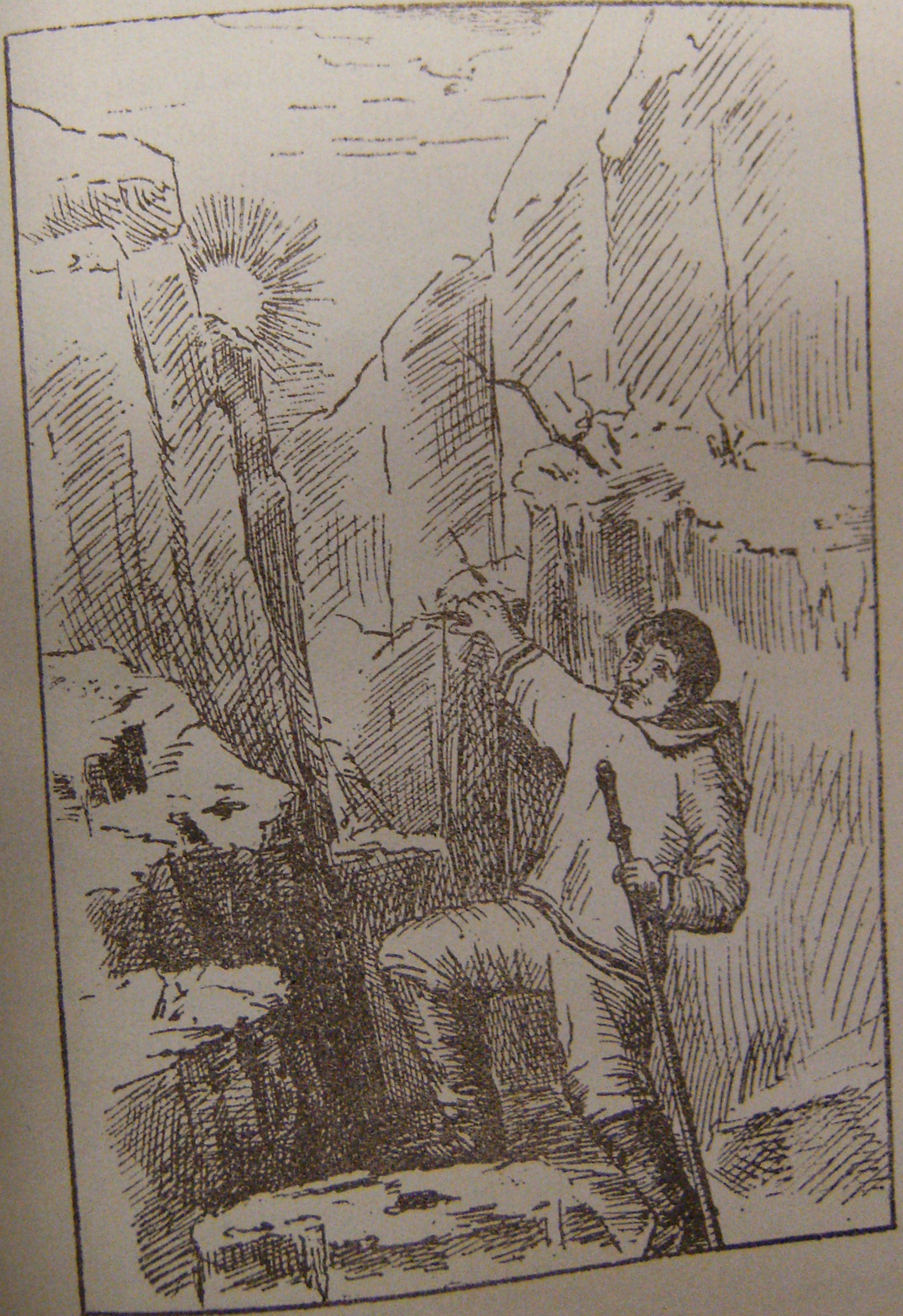
KRISTIA B MAJORARNINGA.

Appertsorungnaralloarpogut, suna pivlugo okpertut. о к у м а и т о к у т ингергаркожаукаттармангата. Крис- tia okpertut nellâgôrtut piusinginik illinganinginiglo sakkertitsingmat, nellonangilak, tâpkoa okitutigut alia-